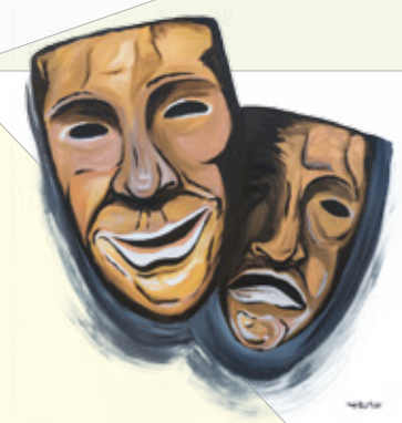
Verità in maschera Acrilico su tela (2017) Salvatore Morgante

Arte e Scienza Lo Stomachion e le Maschere come anello di congiunzione tra Arte e Scienza - Arte e Vita. Nelle Maschere e nello Stomachion c'è l'origine della nostra storia, fatta da scienziati ed artisti, in cui l'artista era scienziato e lo scienziato diveniva artista. Attraverso lo Stomachion - rompicapo ideato da Archimede per i bambini - i fanciulli di Siracusa affinavano la loro mente per poter vivere, rappresentare e partecipare l'arte ed il teatro.